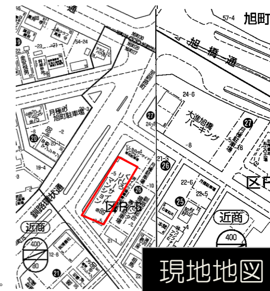
ゼンリン社 ブルマップ